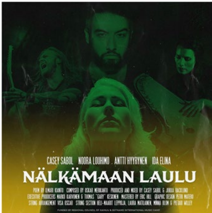
Kuva 2. Nälkämaan laulun metalliversion promoottiokuva

Näkyvimpänä mainetekona oli Ilmari Kiannon juhluvuotta juhlistanut sinfoninen metalliversio Nälkämaan laulusta. Projekti toteutettiin Kainuun liiton sekä Sotkamon ja Suomussalmen kuntien yhteisprojektina. Projekti poiki mm. televisioesiintymisiä (mm. Huomenta Suomi ja Viiden jälkeen) sekä vakituista radiosoittoa. Youtubessa ko. musiikkivideota on nyt katsottu jo yli 250 000 kertaa. Ilmari Kianto 150 -juhlavuoteen Kainuun liiton viestintä osallistui myös mm. viestintä- ja markkinointipäällikön suunnittelemana logolla sekä maakunnan liiton henkilöstön työpanoksella vuoden eri järjestelyihin.