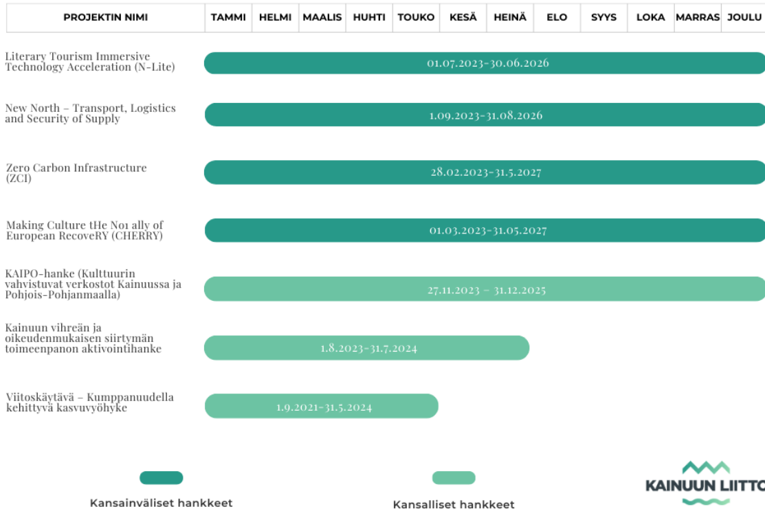
Kuva 3. Kainuun liiton projektit vuonna 2024