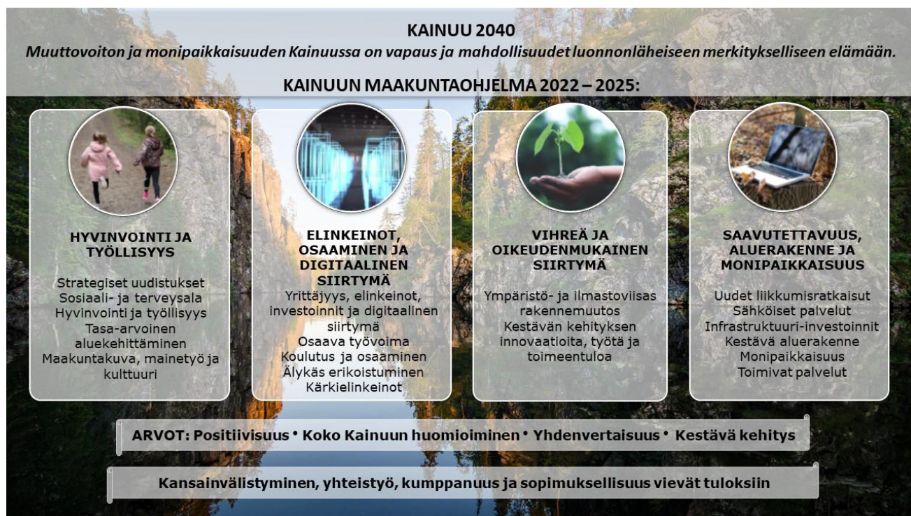
Kuva 2. Kainuun maakuntaohjelman 2022–2025 rakenne.

Maakuntaohjelma on osa Kainuu-ohjelmaa, joka sisältää myös vuoteen 2040 ulottuvan maakuntasuunnitelman. Kainuu 2040 visio tiivistää Kainuu-ohjelman keskeiset tavoitteet: runsas muuttovoitto, kestävä väestön kehitys, osaavan työvoiman riittävyys, kasvava monipaikkainen asuminen ja vierailut Kainuussa, ilmasto- ja ympäristövastuullisuuden sekä Kainuussa olevien ja sinne tulevien yhteisöllisyyden ja merkityksellisyyden vahvistuminen. Visioon pyritään maakuntasuunnitelman pitkän ajan kehittämistavoitteilla sekä maakuntaohjelman vuosien 2022–2025 tavoitteilla ja toimenpiteillä. Kuvaan 2 on tiivistetty maakuntaohjelman rakenne.