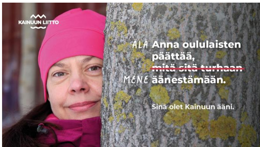
Kuva 2. "Kainuun ääni" – mainoskampanja äänestysaktiivisuuden puolesta

Toimintavuoden 2023 isoimmat panostukset aluemarkkinoinnin saralla olivat äänestysaktiivisuuteen keskittynyt aktivointikampanja sekä uuden maakuntajohtajan rekrytoinnissa avustaminen. Huomioitavia markkinointikampanjoita olivat Kajaanin Hakan yhteistyökumppanina toimiminen heidän vauvabodykampanjassaan sekä osallistuminen Kajaanin ammattikorkeakoulun uusille opiskelijoille suunnatun "fuksiämpäriin" sisältöön. Uusi maakunnan sisäisen markkinoinnin kokeilu oli osallistuminen Kajaanifest -festivaaleille yhdessä halukkaiden kuntien kanssa. Perinteisenä ponnistuksena maakunnallisen mainityön saralla oli tammikuun matkamessut Helsingissä.