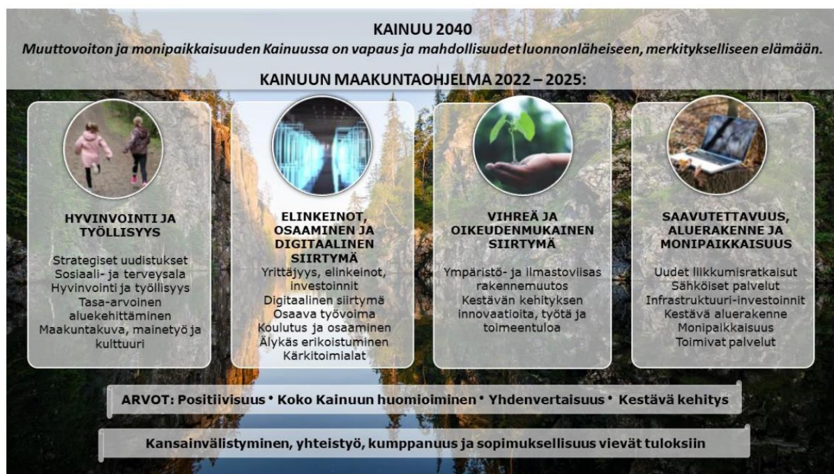
Kuva 2. Kainuu-ohjelman rakenne ja painopisteet.

Kainuun maakuntavaltuusto hyväksyi vuoteen 2040 ulottuvan maakuntasuunnitelman ja maakuntaohjelman 2022-2025 käsittävän Kainuu-ohjelman joulukuussa 2021. Kainuu-ohjelman visiona 2040 on "Muuttovoiton ja monipaikkaisuuden Kainuussa on vapaus ja mahdollisuudet luonnonläheiseen merkitykselliseen elämään". Kainuu 2040 on hyvinvoiva, moderni ja elinvoimainen maakunta, haluttu asumisen, työnteon, opiskelun ja vapaa-ajan vieton paikka. Kainuun maakuntaohjelmaan 2022-2025 on valittu neljä painopistettä: 1. Hyvinvointi ja työllisyys, 2. Elinkeinot, osaaminen ja digitaalinen siirtymä, 3. Vihreä ja oikeudenmukainen siirtymä sekä 4. saavutettavuus, aluerakenne ja monipaikkaisuus (kuva 2).